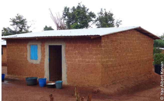
Le projet visait à favoriser des retours durables. Le réseau d'évacuation a été entretenu par 80 % des occupants des abris.