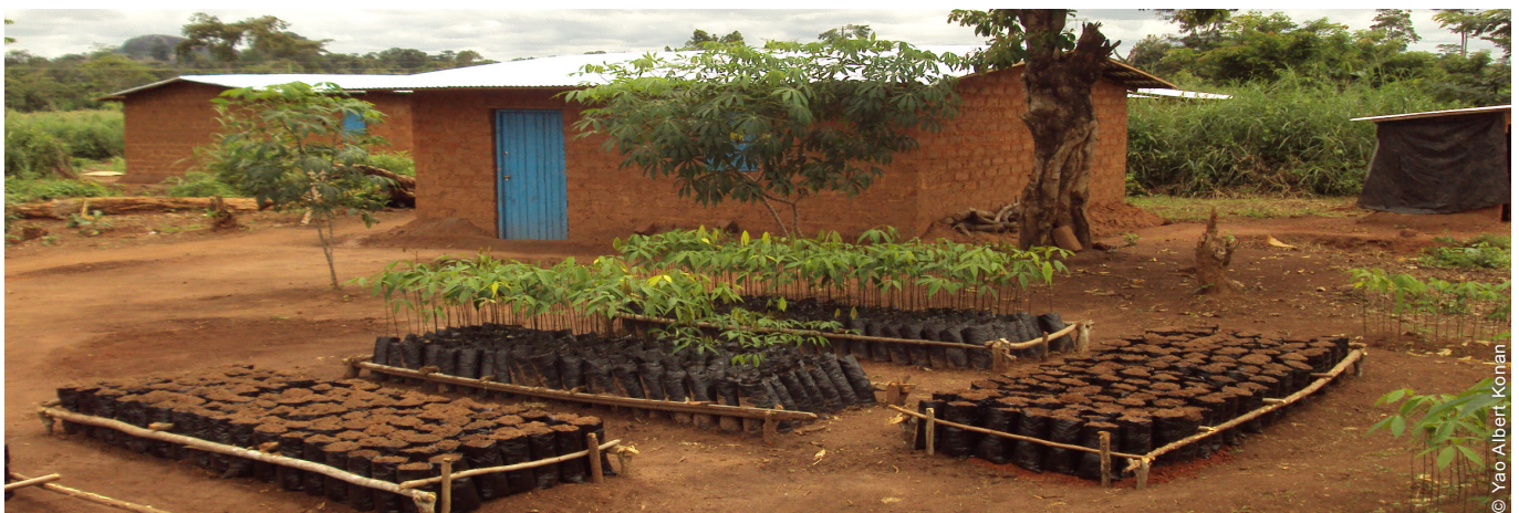
Le projet visait à favoriser des retours durables. Le réseau d'évacuation a été entretenu par 80 % des occupants des abris.

Certains maçons recrutés par l'organisation ont construit le modèle de maison pour d'autres entrepreneurs privés, mais n'ont pas utilisé de toiture en tôle pour des raisons de coût.